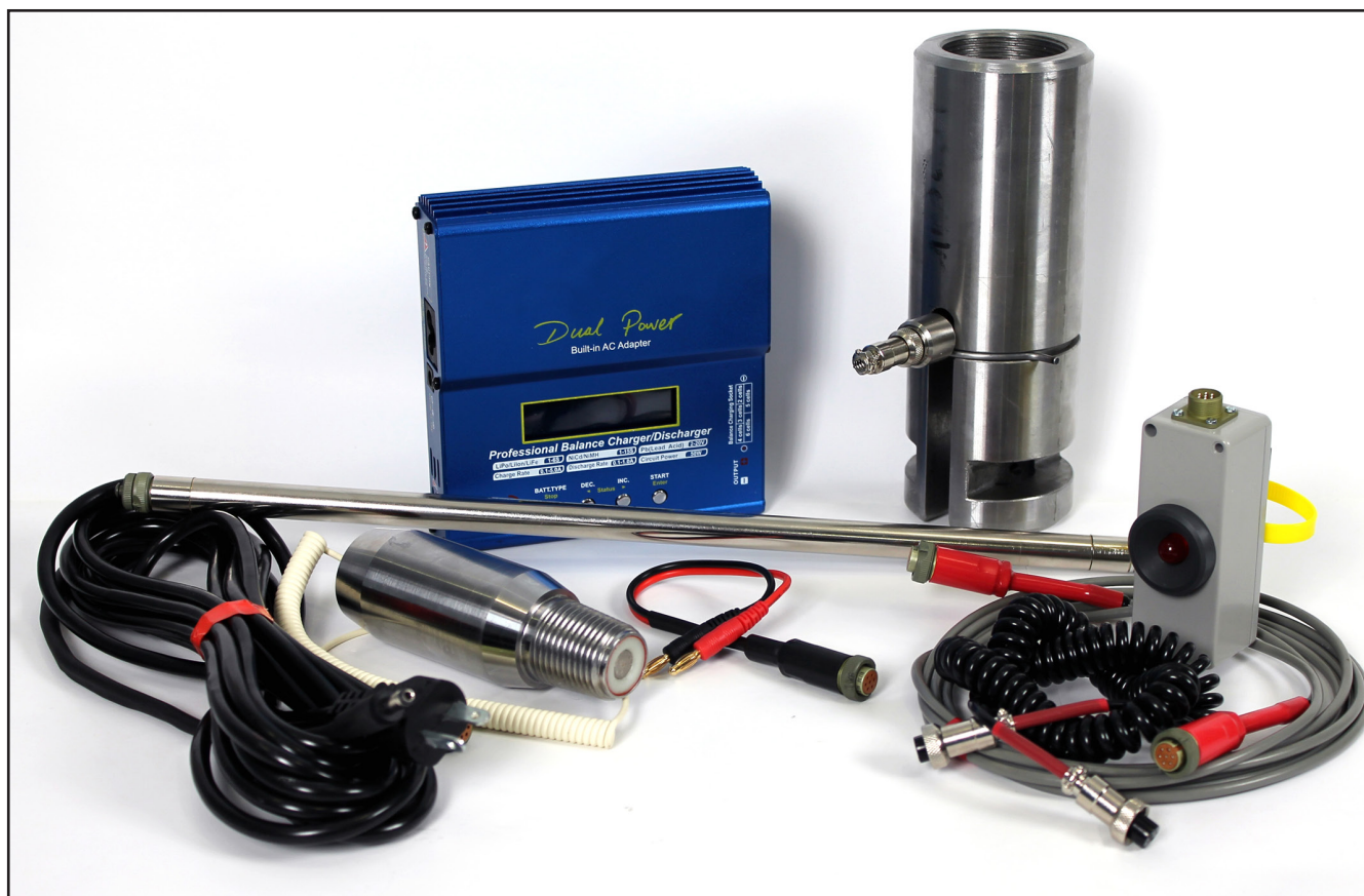
Рис.1. Внешний вид комплекта БПД1