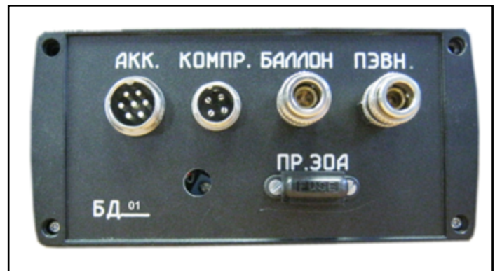
Рис.3. Задняя панель прибора БД-1

При подаче питания на прибор загорается зеленый индикатор.