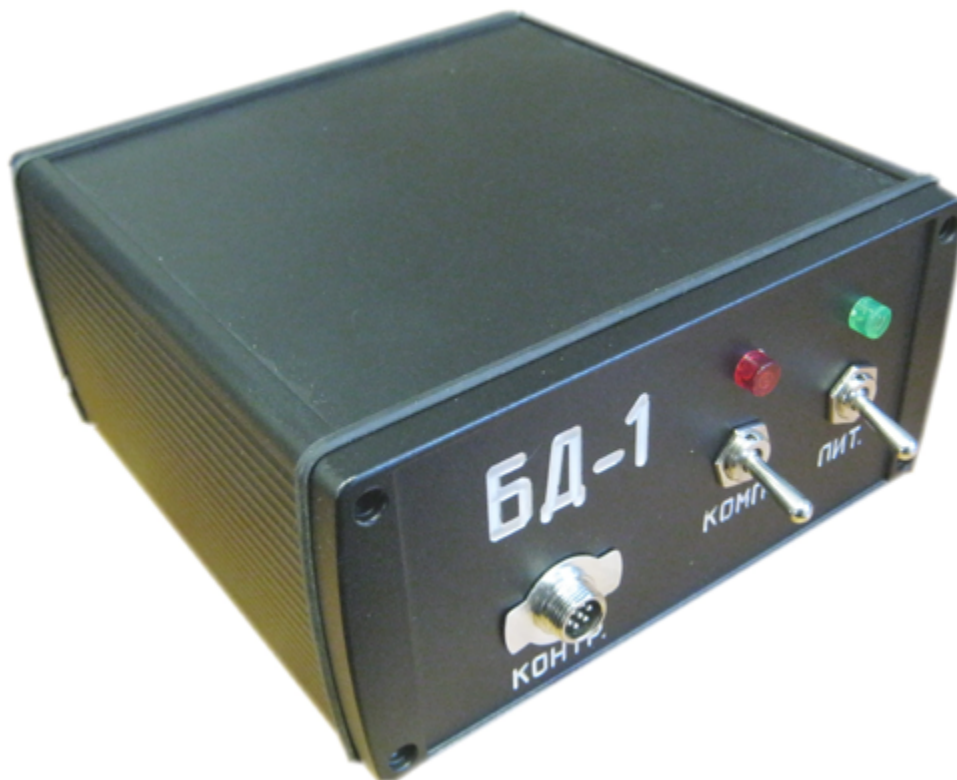
Рис.1. Внешний вид Блока Давления БД-1