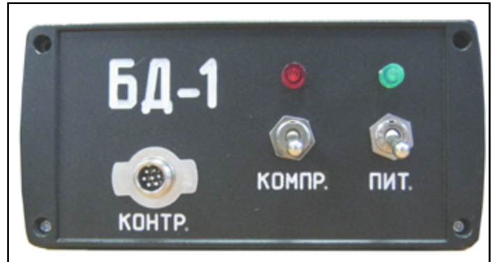
Рис.2. Передняя панель прибора БД-1

В процессе автоматической подкачки ресивера, загорается индикатор.